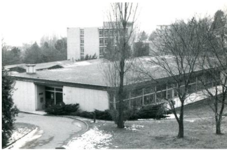
En octobre 85, le LAMI déménage au Pavillon

En 1985, le bâtiment INF à Ecublens n'était pas construit, et il fallait libérer Bellerive 16, futur Gymnase A. Piccard. Le pavillon construit pour la photogrammétrie a été notre refuge pendant trois merveilleuses années.